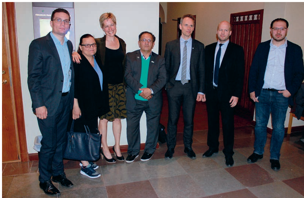
Romerna som stämt staten tillsammans med sina juridiska ombud.

– Det handlar om att undersöka en viss brottslig verksamhet. Släktförhållanden utreds ofta när det till exempel handlar