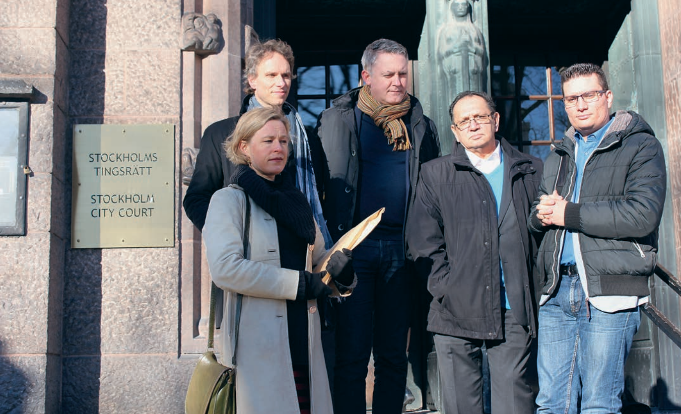
Inlämning av stämningensansökan till Tingsrätten mars 2015