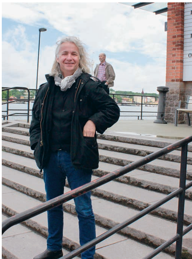
Fotografen själv utanför Fotografiska i Stockholm.