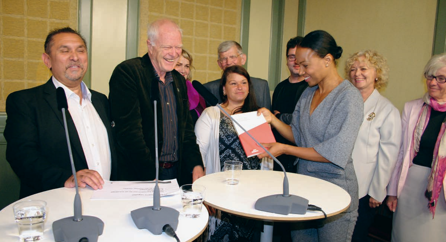
Thomas Hammarberg med delar av kommissionen överlämnar slutrapporten till kulturminister Alice Bah Kuhnke.