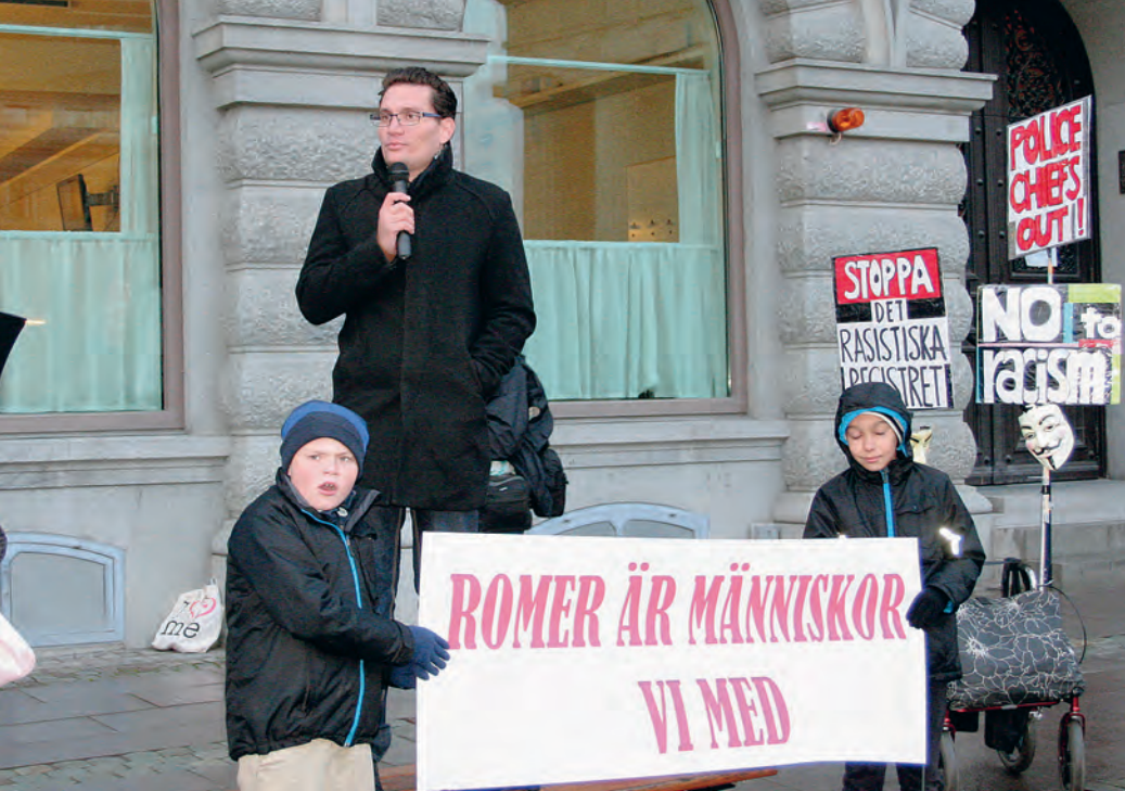
Manifestation på Mynttorget