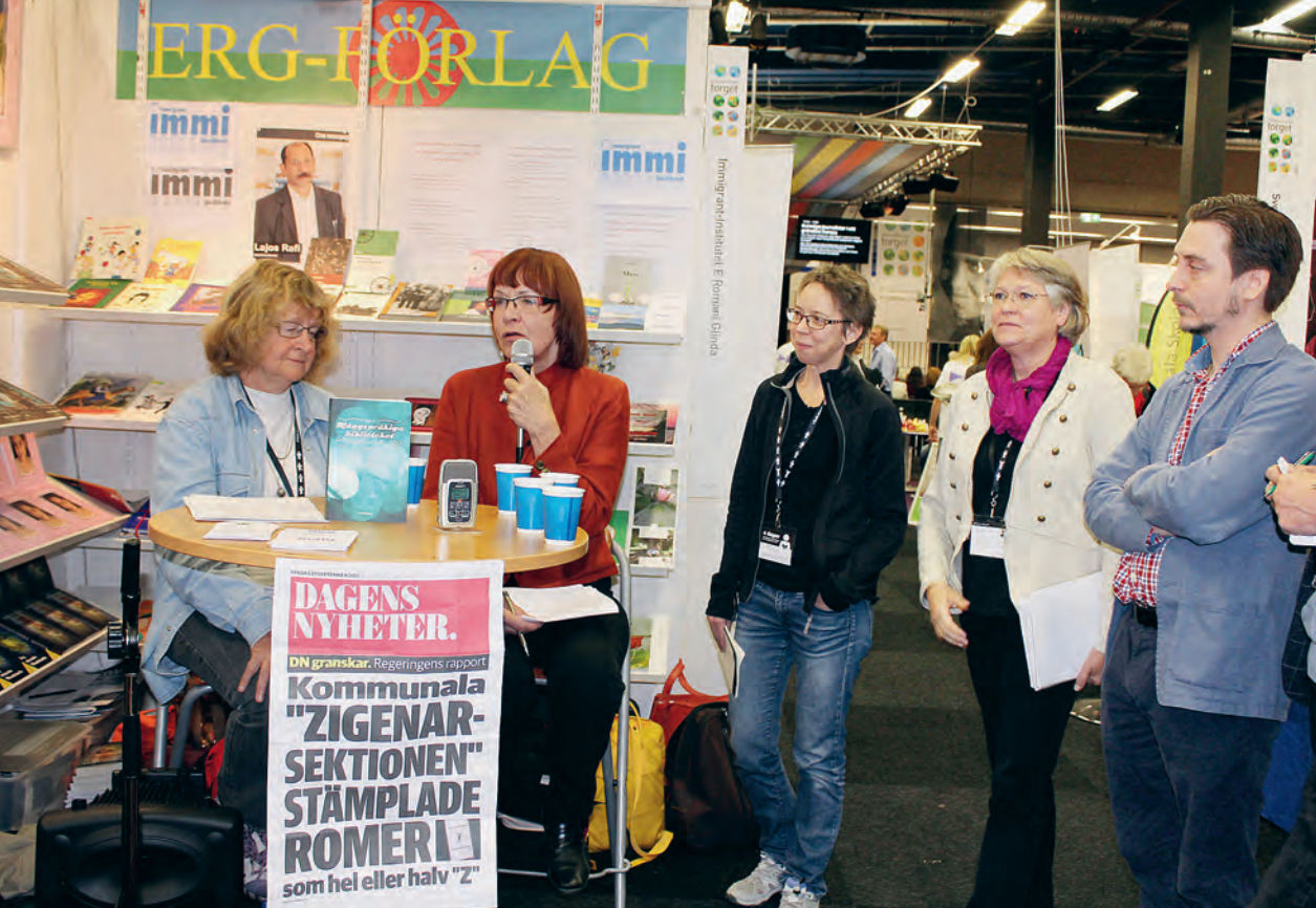
Monterseminarium med bibliotekarierna.