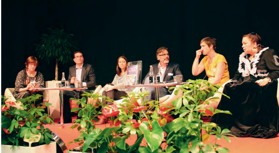
På Debattscenen: Hur stoppar vi antiziganismen?

– Det som hände i nazityskland är en grotesk spegel. De föreställningarna finns fortfarande. Romerna sågs som ett socialt